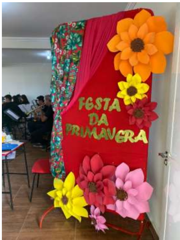
FESTA DA PRIMAVERA COM AS IDOSAS:

SOCIEDADE FILANTRÓPICA SEMEAR DE MEDIANEIRA – PARANÁ Fundada em 10/03/2003 CNPJ: 05.774.123/0001/-01